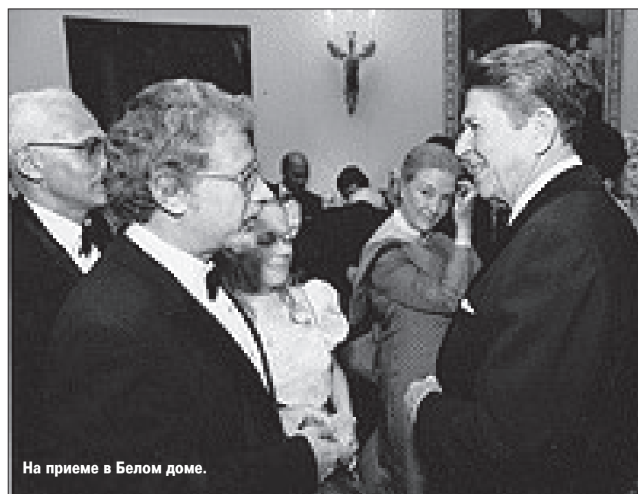
На приеме в Белом доме.